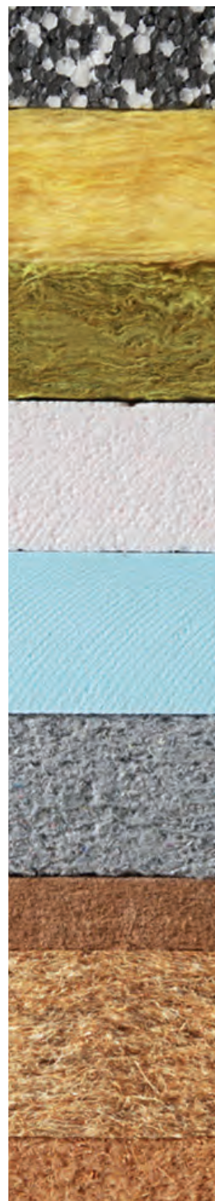
Panneaux de mousse rigide (XPS)